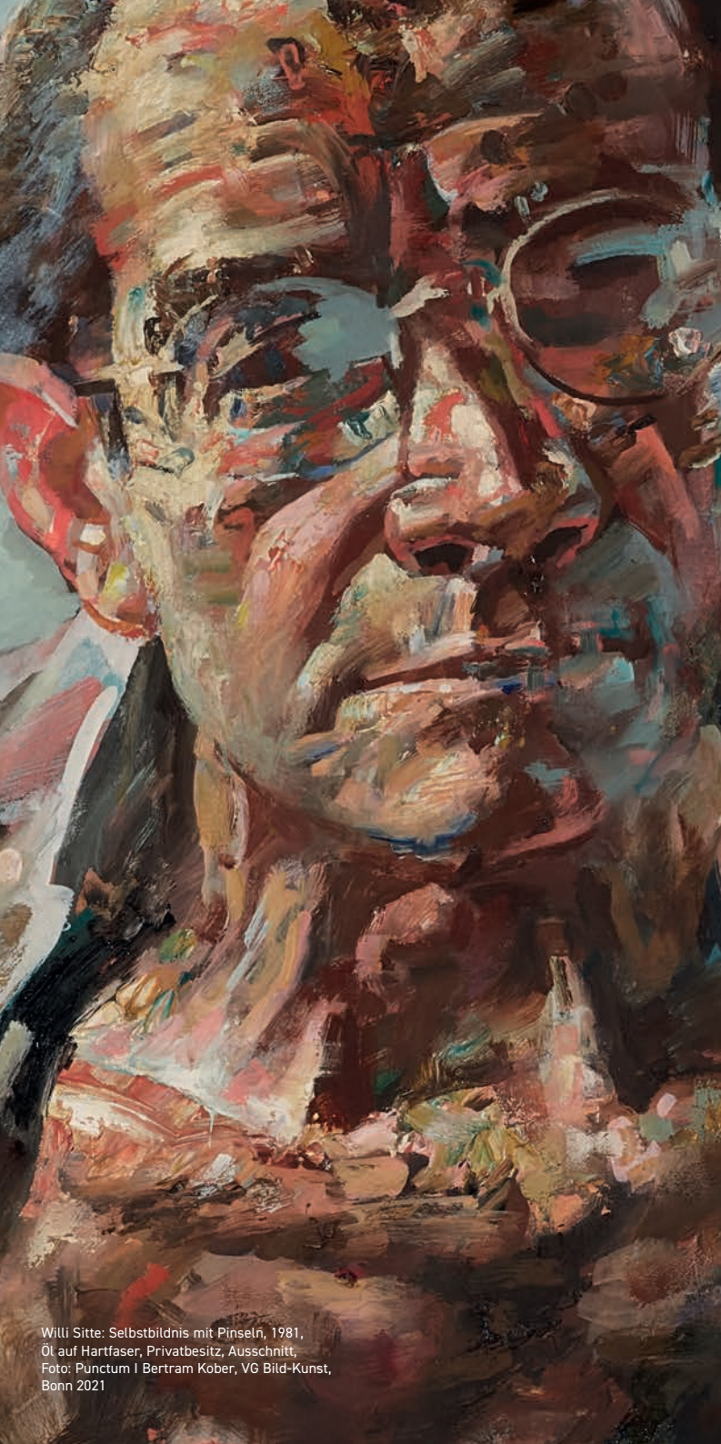
Willi Sitte: Selbstbildnis mit Pinseln, 1981, Öl auf Hartfaser, Privatbesitz, Ausschnitt, Foto: Punctum | Bertram Kober, VG Bild-Kunst, Bonn 2021

Weitere Informationen, Tagungsprogramm und Anmeldung ab 15. September 2021 unter www.willi-sitte-tagung.de