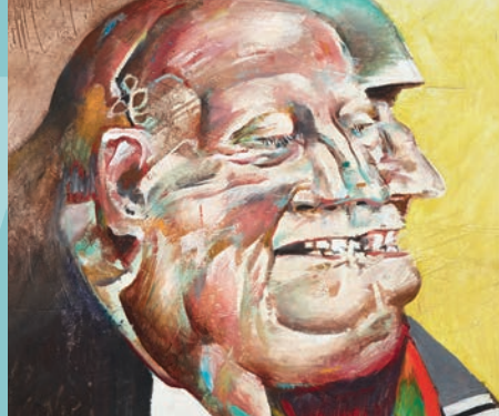
Willi Sitte, Multis, 1978, Öl auf Hartfaser, Kunstmuseum Moritzburg Halle (Saale), Foto: Punctum | Bertram Kober, VG Bild-Kunst, Bonn 2021

zum Maler und Funktionär Willi Sitte aus Anlass der großen Willi-Sitte-Retrospektive im Kunstmuseum Moritzburg Halle (Saale)