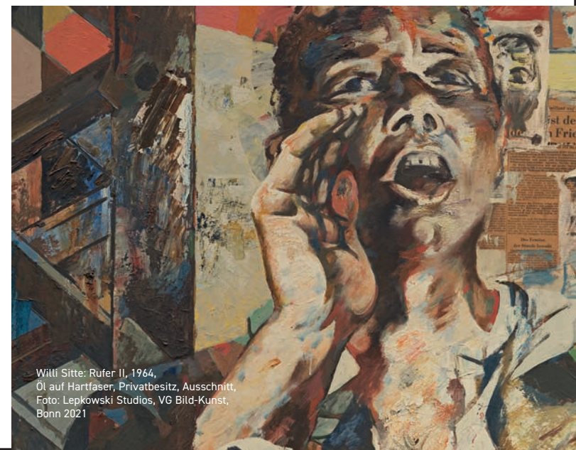
Willi Sitte: Rufer II, 1964, Öl auf Hartfaser, Privatbesitz, Ausschnitt

Empfang (im Anschluss der Veranstaltung)